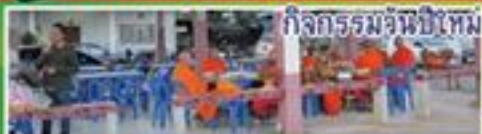
กิจกรรมวันปีใหม่